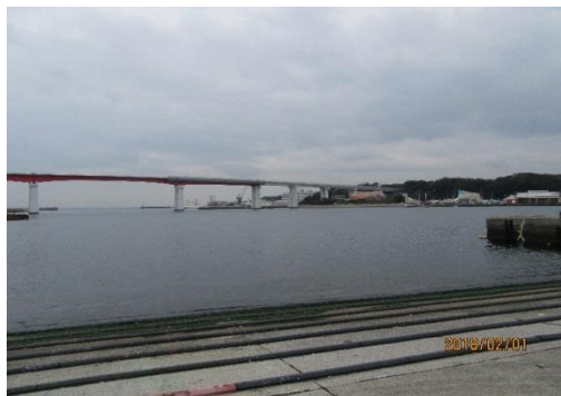
【城ヶ島大橋と城ヶ島】

(コース) 集合地→二町谷北公園(WC)→うらり(WC)→城ヶ島公園(WC)→ゴール①三崎港バス停、②京急・三崎口駅