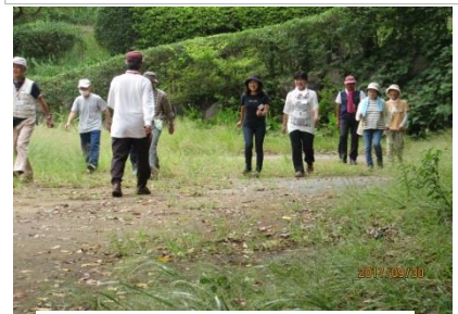
【ウォーキング教室風景】