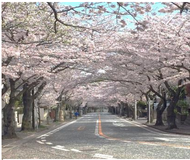
[湘南鷹取の桜並木ドーム]

(コース) 追浜駅前デッキ→追浜小学校→鷹取山公園(WC)→展望台 →鷹取山尾根道→南郷公園(WC)→京急田浦駅