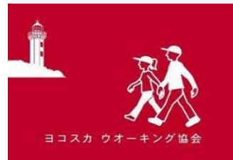
ヨ WA 協会旗

ヨコスカ ウオーキング協会の2017年度の全行事は、 横須賀市の「後援」を受けています。