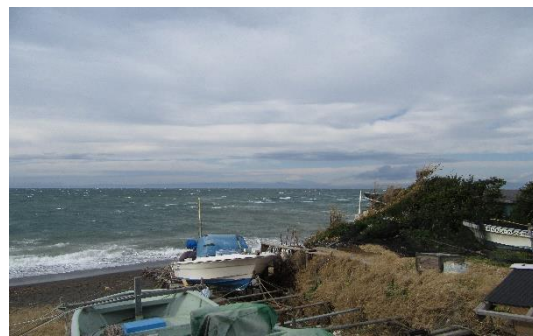
【白波が立つ三戸海岸】

前夜の雨は朝には上がったがスタート地点ではまだ曇り空。その上、強風で帽子も飛ばされそうになり、大変でした。出発して間もなく、いつもなら白銀に輝く富士の雄姿が望める野菜畑であるが、今日はその形がかすかに見える程度であった。三戸海岸では猛烈な風におおられた白波が岸に打ち寄せていた。それでも相模湾越しにうっすらと白い富士の姿が垣間見れたのは救いであった。 Y.M