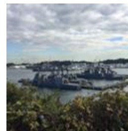
【安針台公園からの景観】

歩き始めて10分ぐらいすると安針台公園に到着します。ここからは眼下に米国海軍の艦艇が一望できます。さらに進むと、左下にJR横須賀線の線路と海上自衛艦隊が見えてきます。絶景ポイントで、愛好家の撮影ポイントになっています。ヴェルニー公園からはどんな艦船が見られるか楽しみです。三笠公園には記念艦「三笠」がお出迎えです。港の景観を楽しんだ後は、ゴールとなっている市民活動サポートセンターで開催されている「のたろんフェア2020」(100を超える市民公益活動団体の日ごろの活動を多くの皆さんに知っていただくための市民活動フェア)を楽しみましょう。