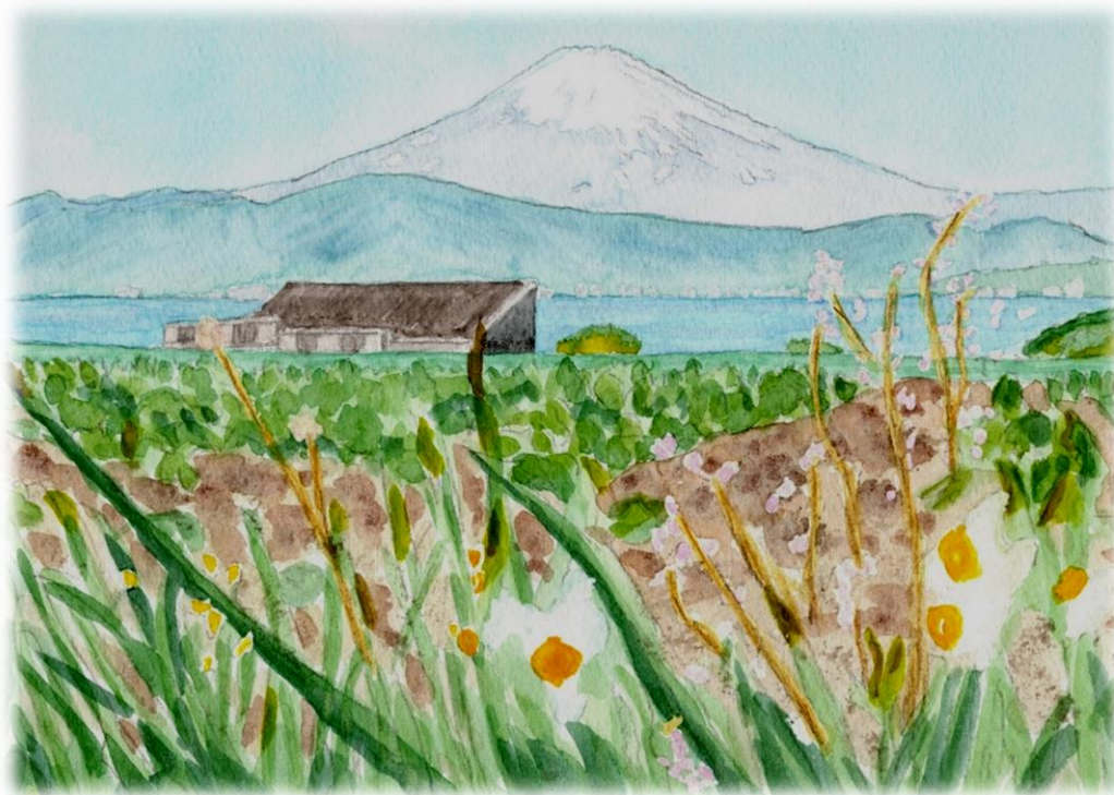
三戸の畑よりの富士山