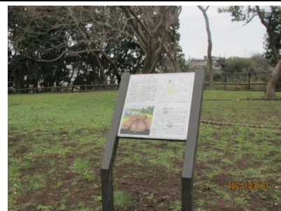
【吉井貝塚・怒田城址】

京浜急行の変電所がある山一帯が吉井貝塚です。変電所の建設の際の発掘調査で縄文時代(約8000年前)から古墳時代((約1400年前)までの土器、石器あるいは骨角器、又住居跡などが出土し、漁労関係のものは当時の人々の漁法を知る上で大変貴重なものであり、県内でも有数の遺跡として、県の指定史跡となっています。又、この山は鎌倉時代の三浦一族の水軍基地、怒田城のあとでもあり、船を置いた一帯が、現在「舟倉」という地名で残っています。