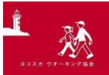
ヨコスカ ウオーキング協会旗

掲載の行事は全て会員以外の方も予約なしで参加できます。 ホームページ等で例会開催確認の上、受付時間内に直接お越しください。