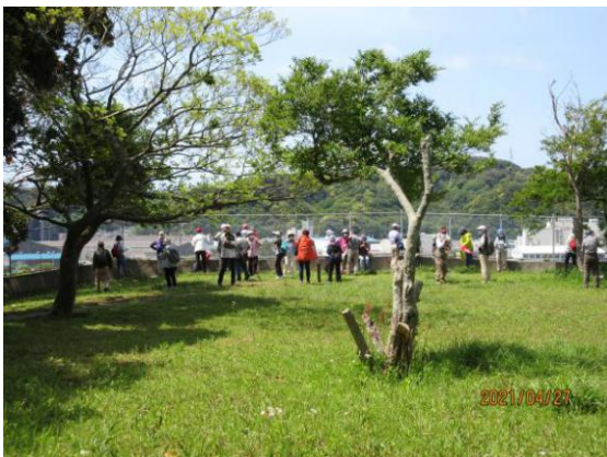
【吉井貝塚・怒田城址】

コロナ禍でしたが、由緒ある「吉井貝塚・怒田城址」の名に魅せられ参加しました。吉井貝塚は縄文時代早期から古墳時代後期までの土器、石器あるいは骨角器などが出土し、県内有数の遺跡で、県指定史跡であることも知りました。コース全体の距離は短いものの、アップダウンも織り交ぜた歩き易い行程でした。途中、小高い丘の吉井貝塚で久里浜市内を見下ろせる台地で休息を取り、その後、真福寺～御林～東福寺～西叶神社とまわり浦賀湾を行き来する小船を右に見てゴールの浦賀駅前に正午頃に到着しました。天候にも恵まれウォーキングを存分に楽しめました。いつも役員の方々には感謝しております。(Y.K)