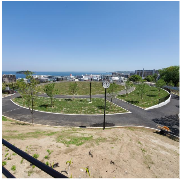
【新しくなった平和中央公園】

これまで教室の会場としてきた中央公園が新しく整備され、平和中央公園として生まれ変わりました。ベッカー提督の像がある高台の場所は、円周コースが取れる平らな場所となり、この場所で、100mの歩行チェックができるようになりました。ヨコスカウォーキング協会では、設立当初からウォーキング教室を続けています。楽しく美しく健康に歩いていただくため初級の教室を行っています。靴の履き方、歩き始めやクールダウン時のストレッチ、歩幅測定、歩く姿勢チェックなどの指導を行います。、100mの歩行チェックでは、歩く速さを変えて心拍数を確認して、どの速さで歩けばいいかを検討します。また、昼食をはさんで、午後のミニウォーキングでは、地図の見方、歩行マナーなどを学習し、クールダウンストレッチで終わります。一度では、なかなか身につかないと考え5回参加して身に付けていただきたいと考えています。コロナが蔓延する中、体力を維持するには、屋外でのウォーキングと考え、ウォーキング教室参加をお待ちしています。