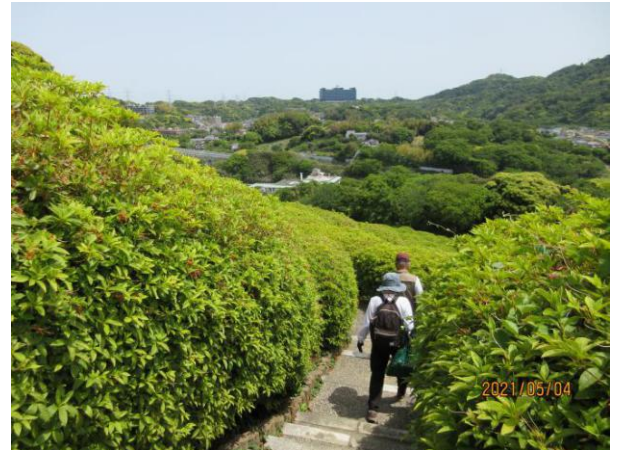
【太田和つつじの丘】

昨年2月以来、1年2ヶ月ぶりに例会に参加させていただいた。五月晴れの中、9時45分からの受付が終了と参加者は順次スタートして行ったが、ここ数週間持病の腰痛に悩まされている私は腰を庇いつつ恐る恐る行列についていった。平作トンネルから衣笠城址の下を通過して太田和街道に入ると勾配の厳しい上り坂が待っており、コロナ禍による外出規制をよいことに体を動かさなかった自分につけが出て、息が上がってしまった。しかし、その先の森林公園に入ると木洩れ日の下で新緑の莖と野鳥の囀りに疲れが癒され再び元気が出てきた。更に太田和つつじの丘に向かい歩を進めると先行している人たちから、つつじの丘に行っても花は終わっている旨の情報を得たので残念だがそこでUターンした。