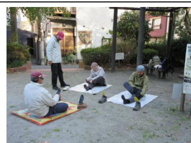
【クールダウンストレッチ】