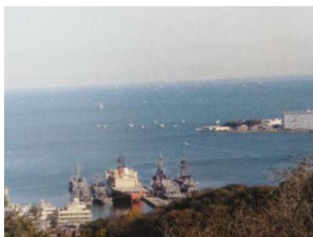
【見晴らし台の展望から】

(コース)集合地→長願寺前→長浦3丁目→十三峠→塚山公園(WC)→鹿島神社→JR横須賀駅前→ゴール