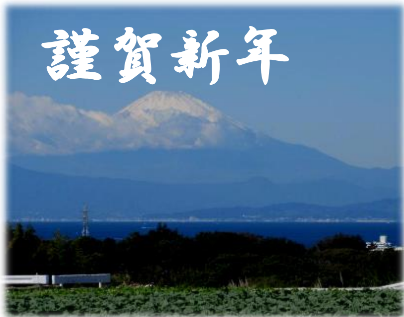
三浦の台地から富士を望む

直近の情報チェックはこちらで! http://yokosuka-wa.pepper.jp/