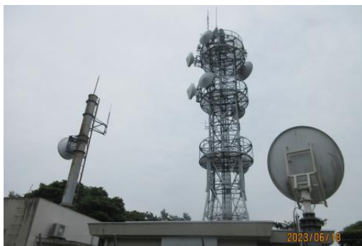
【砲台山のアンテナ群】

(コース)集合地→津久井公園(WC)→武山(WC)→砲台山→光の丘水辺公園(WC)→栗田小学校→ゴール