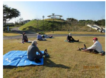
【クールダウンストレッチ】