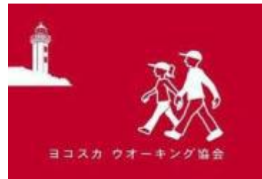
ヨコスカ ウオーキング協会旗

掲載の行事は全て会員以外の方も予約なしで参加できます。 受付時間内に直接お越しください。 ヨコスカ ウオーキング協会の2023年度(2024年3月まで)の全行事は、 横須賀市の「後援」を受けています。