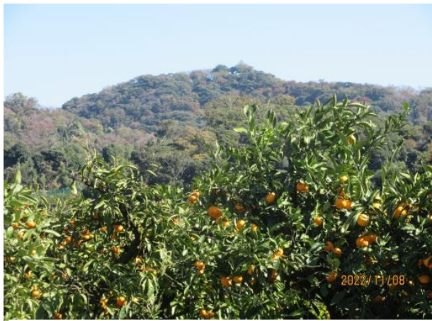
【オレンジロードからの三浦富士】

(コース)集合地→三浦富士登山口→オレンジロード→観光農園→駐車場入口→津久井公園(WC)・観光案内所 →津久井川遊歩道→津久井浜駅