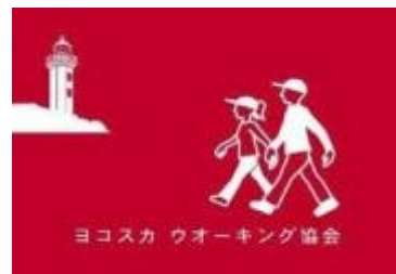
ヨコスカ ウオーキング協会旗

ヨコスカ ウオーキング協会の2025年度の全行事は、横須賀市の「後援」を受けています。