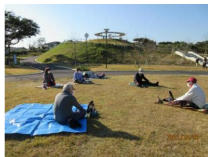
【クールダウンストレッチ】

下記の方は、間もなく年会費の更新時期を迎えます。該当の会員様は、継続の手続きをお願いいたします。 年会費は正会員2,000円家族会員1,000円です。同封の用紙でお振込み頂くか、例会又はウォーキング教室で受付いたします。