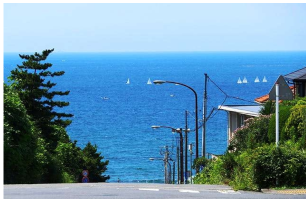
【七里ガ浜七高通りから見る相模湾】

(コース) 集合地→大船3丁目信号→深沢小学校入口信号→セブンイレブン→サンドラック→笛田公園(WC)→珈琲マウンテン→七高通り→稲村ヶ崎海浜公園(WC)→滑川信号→下馬信号→鎌倉駅(ゴール)